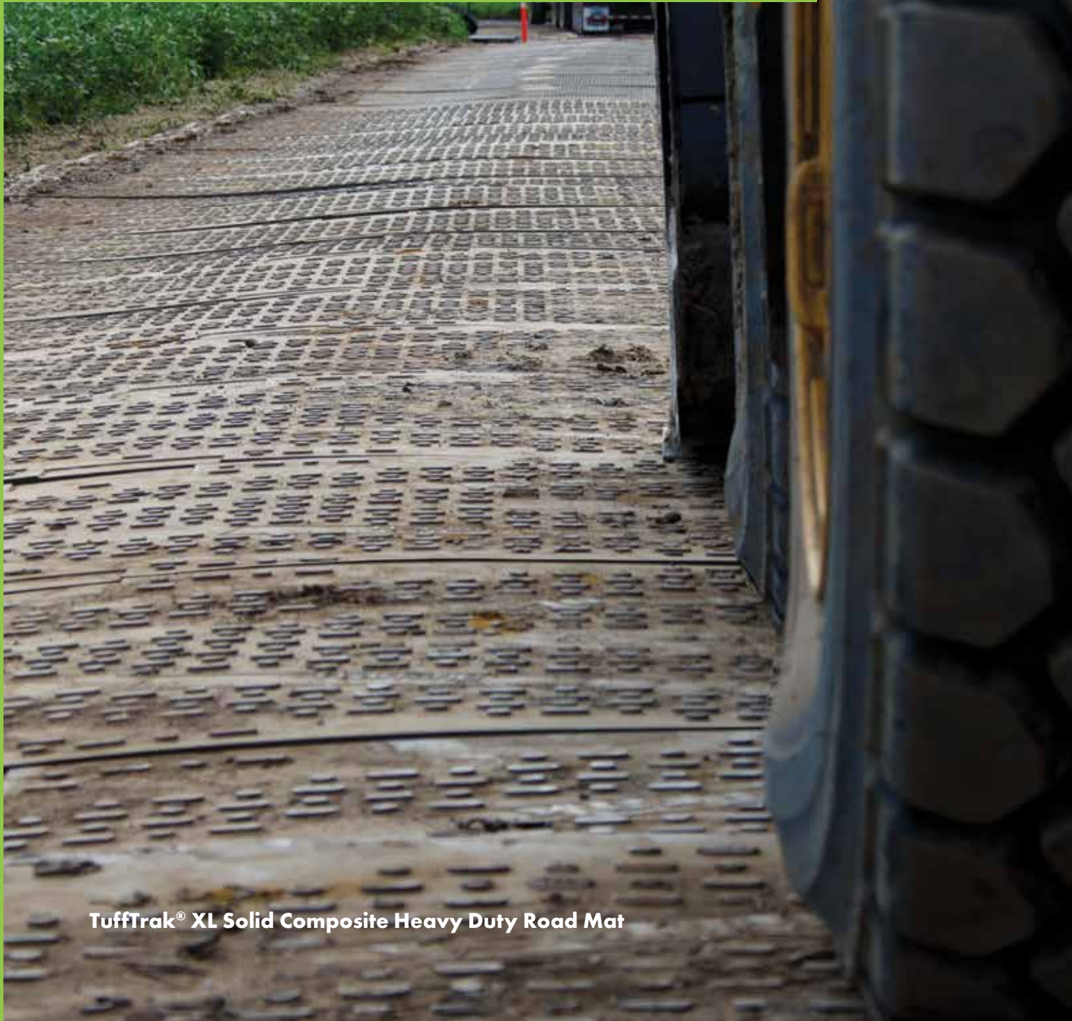
TuffTrak ® XL Solid Composite Heavy Duty Road Mat